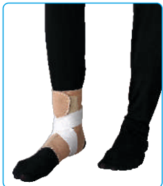
Code: AP01326 قوزک بند Ankle Support