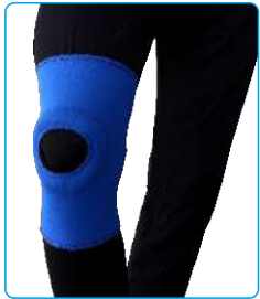
Code: AP01316 زانوبند ساده Knee Support