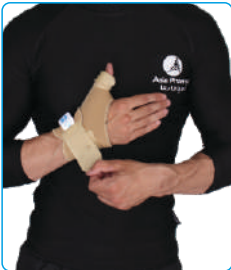
Code: AP01328 شست بند آتل دار Splint Thumb Support