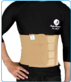
Code: AP01308 شکم بند لافری Sauna Belt