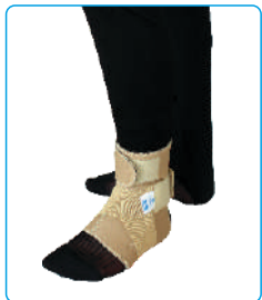
Code: AP01321 قوزک بند فنر دار Ankle Support With Spring