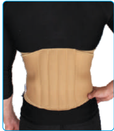
Code: AP01307 کمر بند طبی Lumbosacral Support