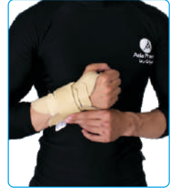
Code: AP01329 مچ بند آتل دار Wrist Brace