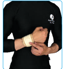
Code: AP01306 مچ بند استرپ دار Wrist Support