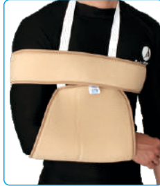
Code: AP01310 آویز دست (اسلینگ) Sling And Swathe