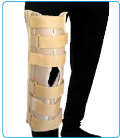
Code: AP01320 ایمی پایزر Knee Immobilizer