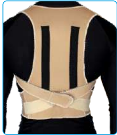
Code: AP01311 قوز بند پل دار Back Posture Aid Brace