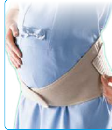
Code: AP01309 شکم بند دوران بارداری Maternity Belt