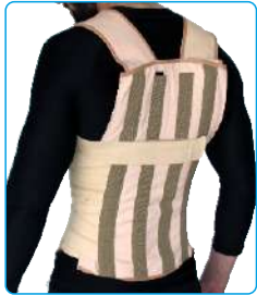
Code: AP01330 قوز بند چهار آتله Posture Back Brace Support Belt