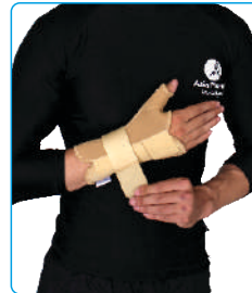
Code: AP01312 مچ شست بند آتل دار Thumb Wrist With Splint