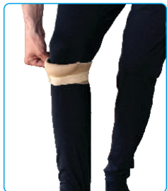
Code: AP01322 بند کشکک زانو Paterllar Strap