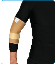
Code: AP01313 آرنج بند Elbow Support