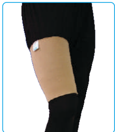
Code: AP01324 ران بند High Sleeves