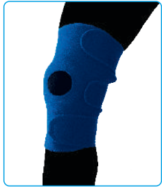
Code: AP01323 زانوبند قابل تنظیم Open Patella Knee Support