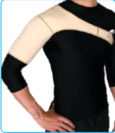
Code: AP01317 شانه بازو بند Shoulder Support