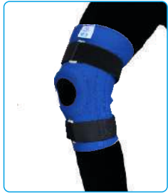
Code: AP01314 زانوبند چهار فنره Knee Support With Four Spring