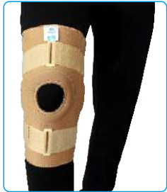
Code: AP01315 زانو بند مفصل دار Hinged Knee Stabilizer