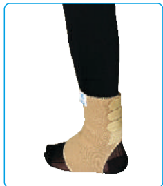
Code: AP01325 قوزک بند پشت باز Ankle Support (Open Back)