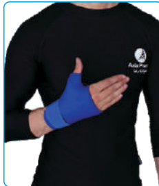
Code: AP01327 مچ شست بند Wrist Thumb Support